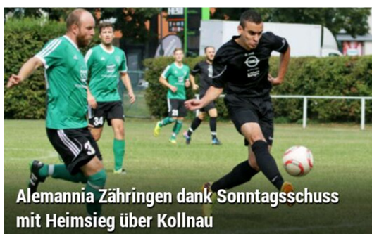
Alemannia Zähringen dank Sonntagsschuss mit Heimsieg über Kollnau